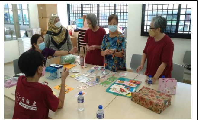
Quilling Class at SGcares VC@Sembawang