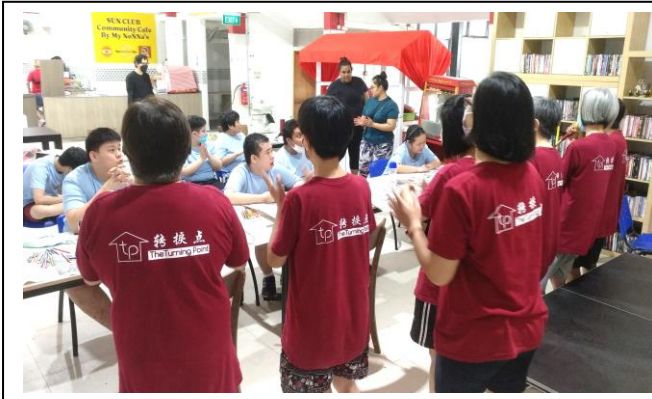
Community Work at Blue Cross -15July 2022