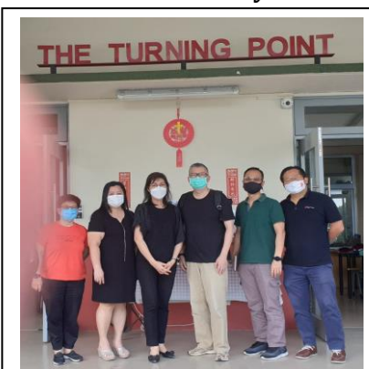
Community Partner PFS - 6May 2022