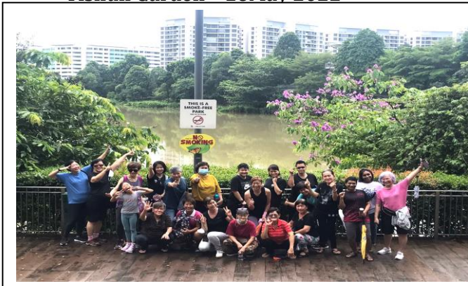
Yishun Garden - 16May 2022