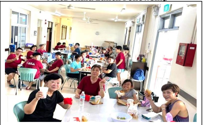
MacDonald Lunch Fellowship